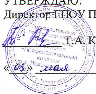
График проведения демонстрационного экзамена с применением методик Worldskills по компетенции